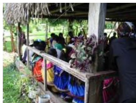
Fotografía 4. Capacitación a ngobes.

Al tratarse de iniciativas socioproductivas, en ninguno de los casos este es el componente principal de las propuestas.