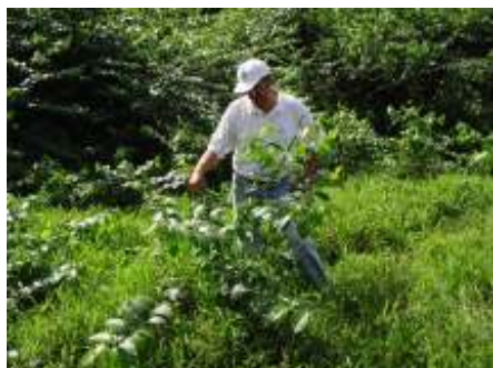
Fotografía 3. Planta de uña de gato

El proyecto “Reproducción y comercialización de plantas silvestres del trópico húmedo en la comunidad del Zota” 18-M-03 ubicado también en Cariari de Pococí, busca el rescate de especies no maderables del bosque para su propagación vegetativa, esto es mediante la propagación in vitro de meristemos radiculares de palmas y otras especies ornamentales. El proyecto ha dotado al grupo meta de destrezas, habilidades y equipo para este trabajo.