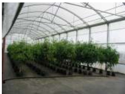
Fotografía 1. Invernadero proyecto 57-M-03

Con algunos proyectos ha sido posible validar el manejo orgánico de cultivos producidos a nivel comercial con una alta demanda de insumos externos como es el caso de la piña. Por otra parte ha sido posible el rescate de variedades de uso doméstico que tradicionalmente han tenido un manejo orgánico, como es el caso del achiote y la uña de gato. Para el caso del achiote, se cuenta además con una experiencia piloto de manejo poscosecha del producto que incluye la extracción de la semilla y el secado con hornos de caldera para su comercialización en seco.