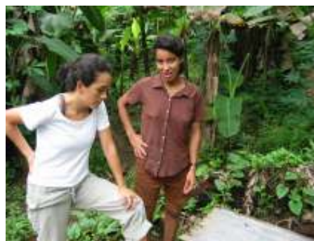
Fotografía 2. Fincas integrales proyecto 18-G-03

El proyecto “Seguridad alimentaria y producción sostenible desde la parcela para una mejor calidad de vida de la familia ngöbe” 15-P-03 ubicado en los cantones de Coto Brus, Corredores y Golfito, Puntarenas atiende las necesidades expresas de 20 familias indígenas de las comunidades ngöbe ubicadas en la Zona Sur del país. El proyecto incluye el rescate de variedades de granos básicos, la incorporación de módulos caprinos y aviares y el establecimiento de cultivos de consumo tradicional en la población indígena como es el caso de musáceas, raíces y tubérculos.